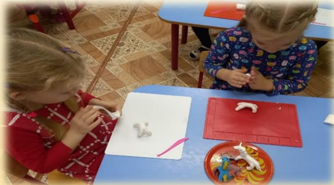
Лепка из воздушного пластилина «Лошадка»